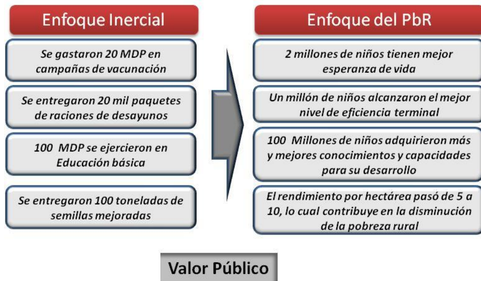
Figura 02.- Presupuesto Inercial Vs PbR

Con el PbR, el proceso presupuestario se transforma en un nuevo modelo orientado al logro sistemático de objetivos y resultados específicos, medibles y tangibles para la población. En este sentido el PbR plantea emigrar de un presupuesto tradicional a un presupuesto con enfoque a resultados.